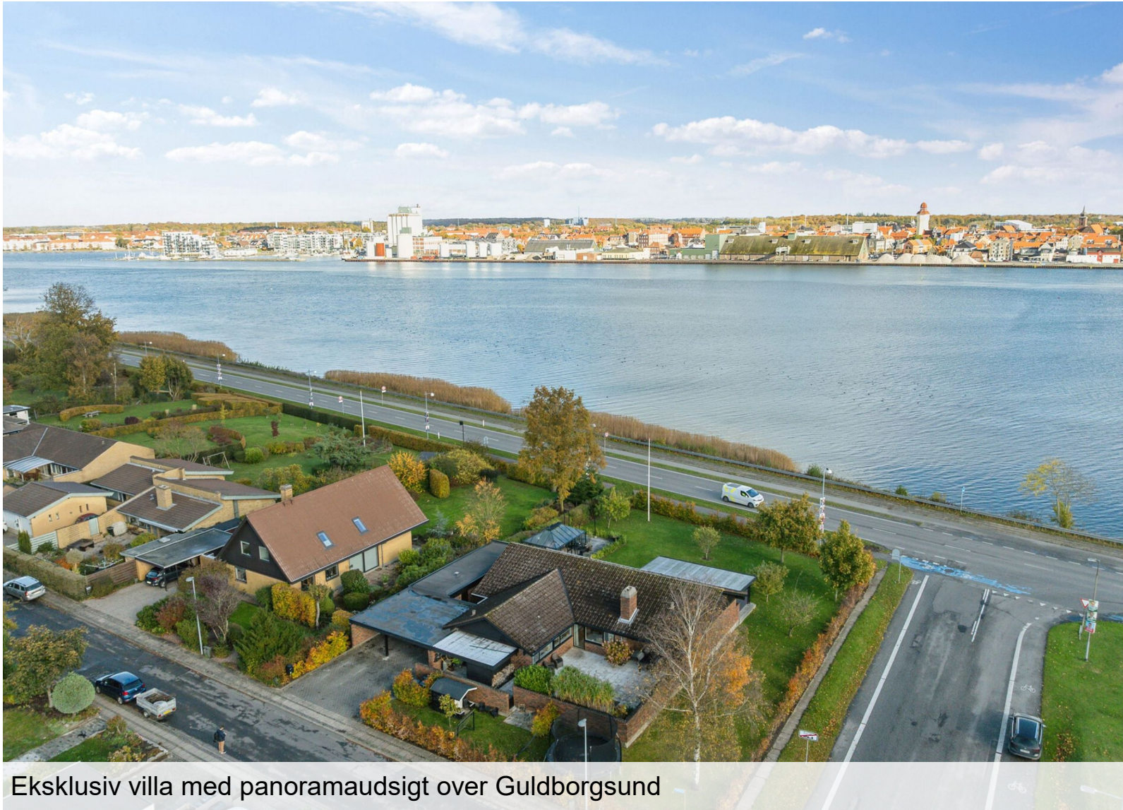
Eksklusiv villa med panoramaudsigt over Guldborgsund

EJENDOMSMÆGLERFIRMAET JOHN OLE HANSEN SIDEN 1984